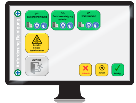
Bildschirm für die Anforderung im OP-Saal

Somit können die erforderlichen Hygienesdienstleistungen nach dem festgelegten Standard eingeleitet und durchgeführt werden.